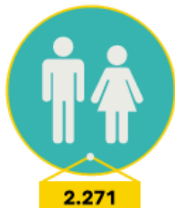
AANTAL DEELNEMERS DAT PENSIOEN OPBOUWT